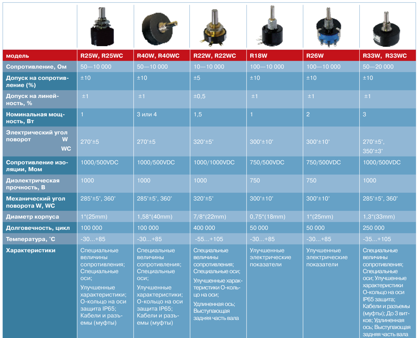
Табл. 1. Проволочные потенциометры RotaSet

В настоящее время быстродействующие АЦП в состоянии фиксировать этот эффект, даже если искажение сигнала от потенциометрического датчика остается очень кратковременным. Такая информация от датчика классифицируется электроникой управления, как потенциальный отказ и схема защиты переключается (срабатывает). Достаточно часто оборудование миллионной стоимости принудитель-